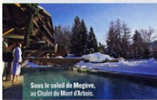
Sous le soleil de Megève, au Chalet du Mont d'Arbois.