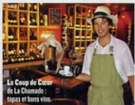
Le Coup de Cœur de La Chamade : tapas et bons vins.